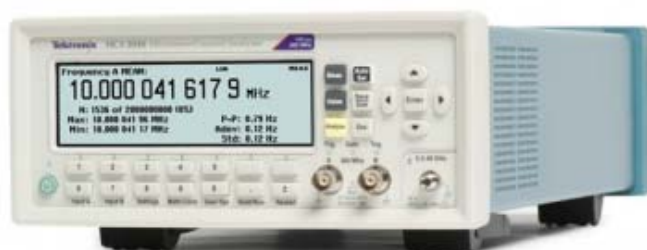
фотография 2 – общий вид моделей MCA