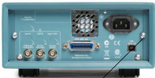
место пломбирования фотография 3 – задняя панель моделей FSA