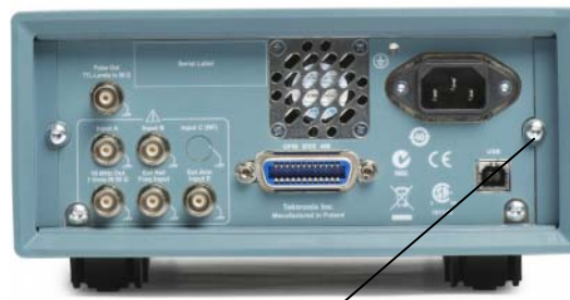
место пломбирования фотография 4 – задняя панель моделей MSA